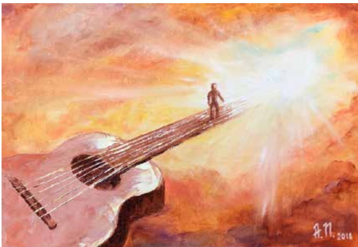
«Я, конечно, вернусь», 40x60, масло, холст, 2018

Я, конечно, вернусь весь в друзьях и в делах. Я, конечно, спую, не пройдет и полгода.