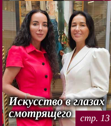
Искусство в глазах смотрящего