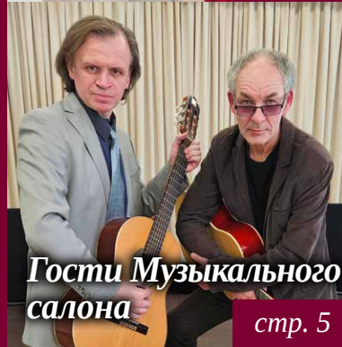
Гости Музыкального салона