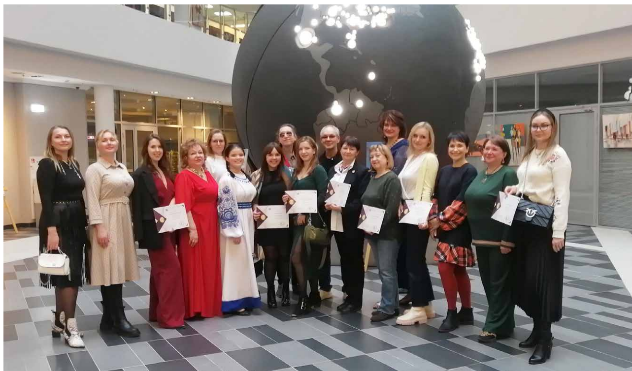
Открытие выставки «Стихия и гармония» в здании R&D Ренова 28 марта 2025