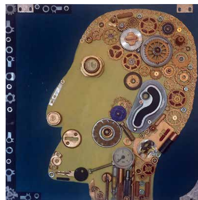
Александр Майданник «Механическая голова»