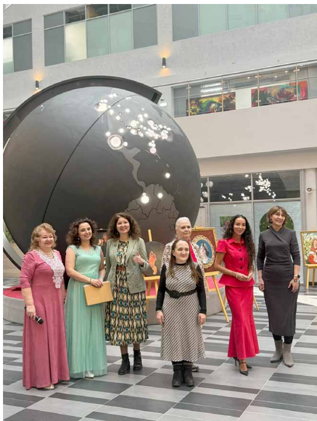
На открытии выставки 5 марта 2025 г.