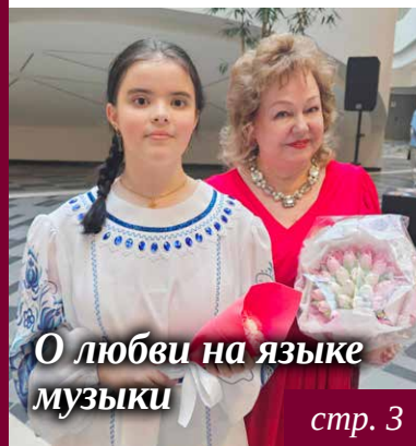
О любви на языке музыки