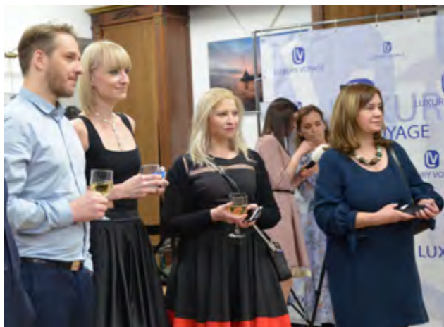
Участники Networking Business Touch