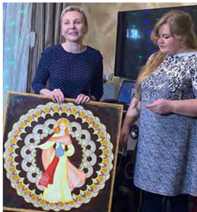
Новая картина Юлии Ра