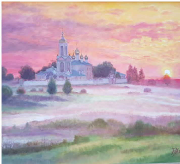
«Храм Покрова на Нерли»

На творчество её вдохновляют окружающая природа, духовность, красота. Любит наблюдать мгновения на лицах людей, преображение архитектуры города, ловить моменты жизни животных, дыхание и замирание природы. В своём творчестве предпочитает реализм. Даже простые по сюжету и красочной гамме работы неизменно эмоционально наполнены, сердечны. Она чувствует целостность создаваемого холста, её картины не дробны, по сути, они художественно очень цельны. Она обладает врождённым чувством цвета. Её реализм – вечно современный, классический реализм нового времени.