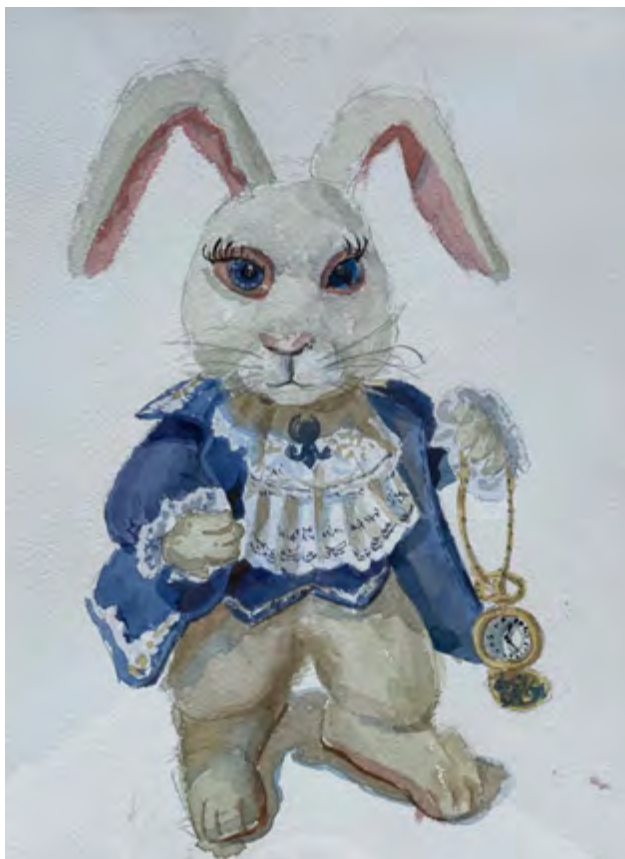
Анастасия Чиналиева «Белый кролик», акварель