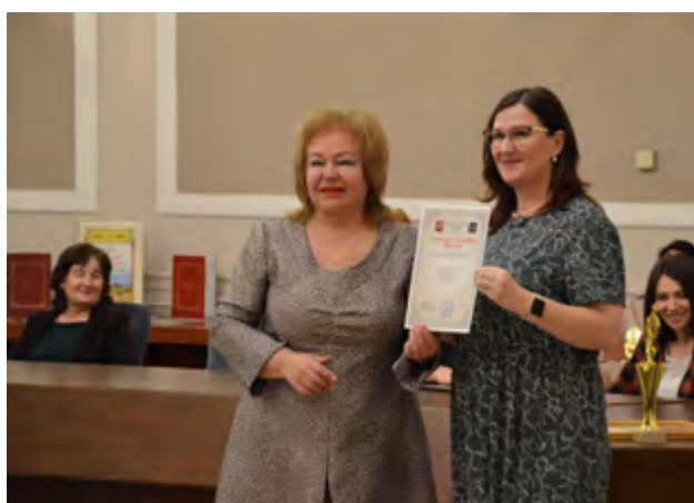
Художница Ольга Репина