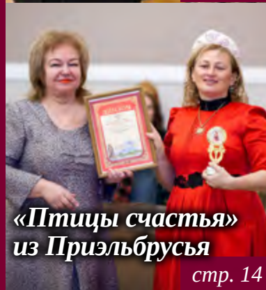
«Птицы счастья» из Приэльбрусья