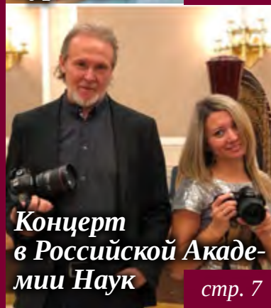
Концерт в Российской Акаде- мии Наук